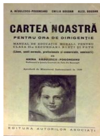
Figura. 1 - Manual de educație morală pentru ora de dirigenție, nivel liceu, școli normale și profesionale, 1938

Reconstrucția sistemului universitar de studii constă, ca întotdeauna, în capacitatea resursei umane, de a avea răbdarea și perseverența necesare pentru a promova în mod constant valorile științifice și etice care au făcut ca universitățile precum cea din Bologna, înființată în anul 1088, ori cea din Oxford, despre care se știe cu certitudine că deja exista în anul 1167, să existe și astăzi. Nevoia unor valori etice bine așezate în psihicul uman nu se remarcă doar la nivel universitar, ci și în profesii dinafara sistemului de educație, de fapt, în orice ocupație. De aceea astăzi, mai mult ca niciodată, este necesar să asigurăm o bună informare și pregătire a viitorilor profesioniști, cât mai devreme și cât mai temeinic, astfel încât acțiunile acestora să fie validate și prin respectarea regulilor etice și a valorilor umane, pentru că numai așa progresul societății va fi asigurat. Ideea de educație morală, de inoculare a unor valori umane universal valabile, nu este nouă. Mare parte din acest tip de formare are loc în familie și în grupul social. Nu vom face un istoric al acestui tip de educație, ce își găsește sorgintea în antichitate (Socrate, Platon, Aristotel), ci vom aminti de sistemul românesc de învățământ care avea în program o astfel de curricula pentru